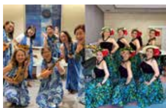
ゆっかい & マカナース & Makaeleu