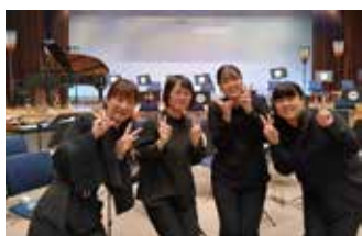
八尾吹奏楽団 フルートアンサンブル