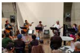
アコギを楽しむ会