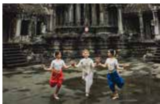
マタビアップ・シラバ・クマエ