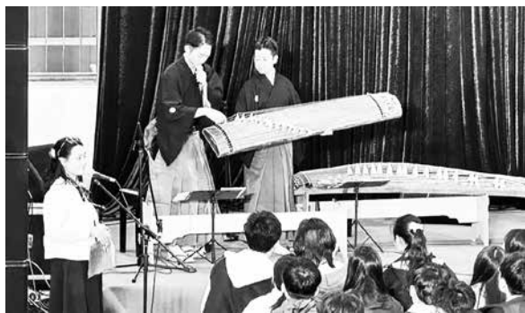
学校アウトリーチ／箏の説明

神奈川県出身。1990年に伝統芸能企画制作オフィス＜古典空間＞を設立。東京都オリンピック文化プログラム検討部会専門委員などを歴任。現在、船橋市文化芸術ホール芸術アドバイザー、船橋市文化振興推進協議会推進委員、（公社）全国公立文化施設協会コーディネーター、共立女子大学文芸学部非常勤講師、他。