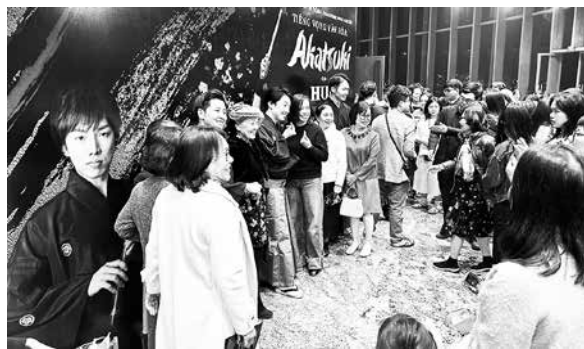
ソンホン劇場、終演後のロビーでの交流