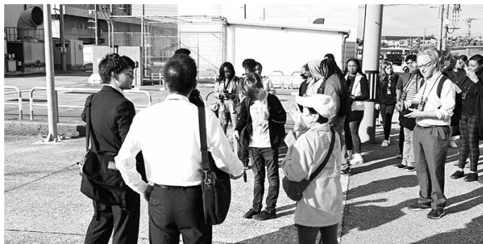
黒部の生地を見学