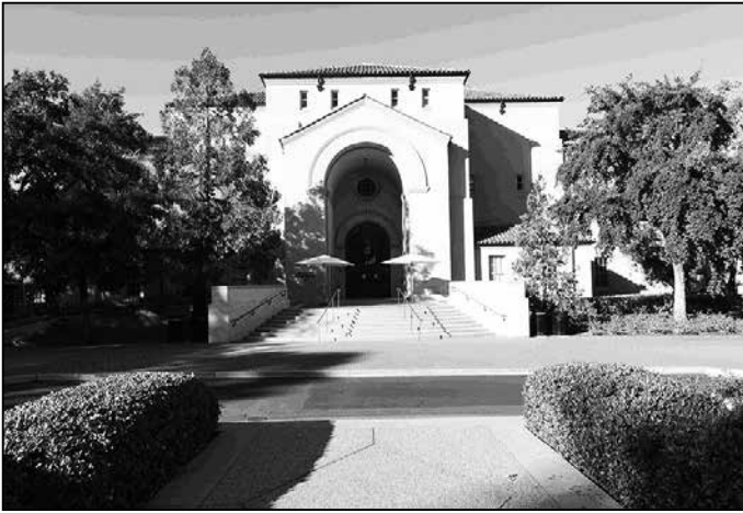
カリフォルニア州パロアルトのスタンフォード大学にある劇場 「Stanford Memorial Auditorium」