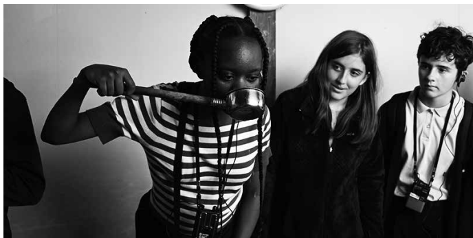
黒部の名水を味わう生徒