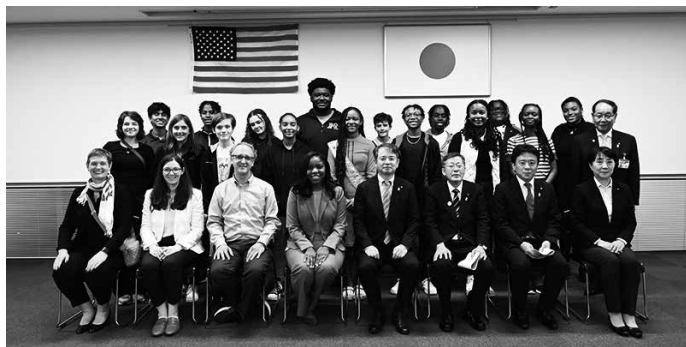
表敬訪問 記念撮影