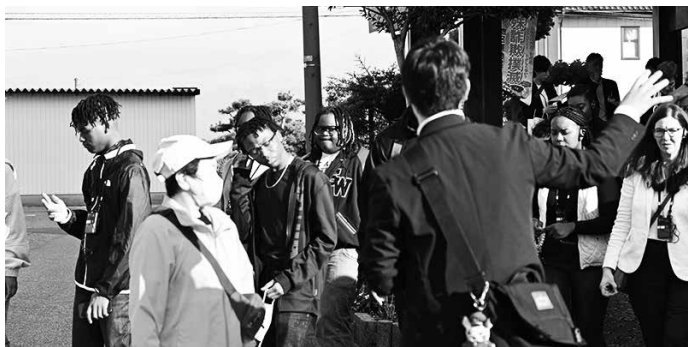
黒部の生地を見学