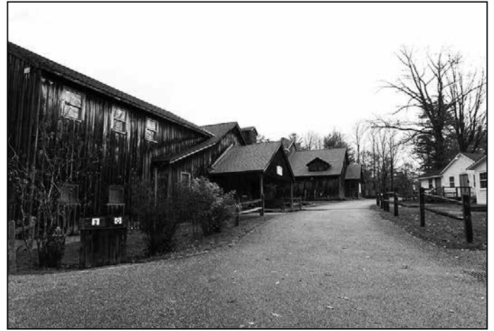
マサチューセッツ州ベケットの山中にある施設 「Jacob's Pillow」

10月19日、飛行機を乗り継いでオールバニ空港からバスで、マサチューセッツ州ベケットの山中にある「ジェイコブズ・ピロー」に着きました。ダンスフェスティバルで有名なこの施設に1週間滞在し、10月22日、3時間のワークショップを行います。ツアー日程が埋まらなかったこの期間を、ジェイコブズ・ピローの宿泊施設で過ごす計画です。支配人の女性から次は山海塾公演をここで行いましょうと申し出が有りました。ところで今回初めて知ったのですが、ニューヨーク州の州都はニューヨークシティーではなく、途中通ったオールバニです。