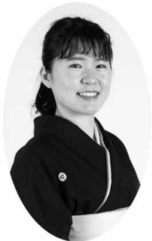
前方：三遊亭美よし（高岡市出身）