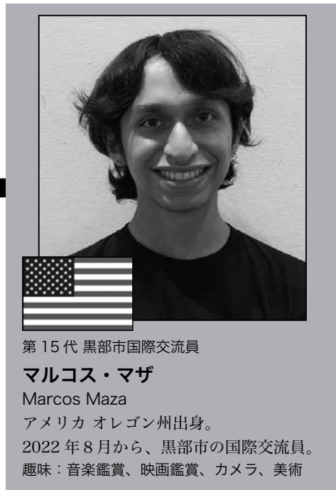
第15代 黒部市国際交流員