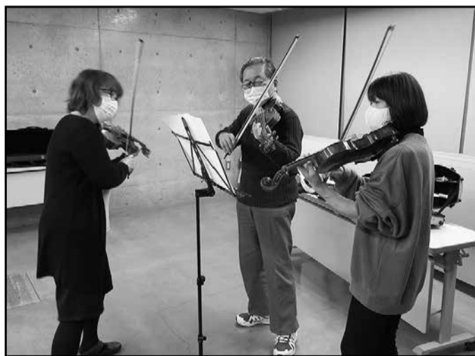
「そう、この小節をまたいでフレーズ感がかわるころは、タリラタリラー、こんな感じで」……と、とても分かりやすく丁寧なアドバイス。弾くたびに表情が豊かに変わっていきます。