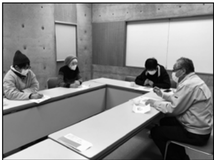
美味しいおやつが付いて来ることもある、和気あいの編集会議。校正作業は真剣な意見が飛び交います。