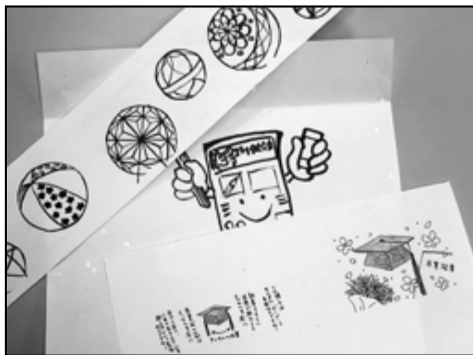
紙面をより読みやすく温かいものにしてくれるイラスト。3人のメンバーが個性豊かに描き分けています。