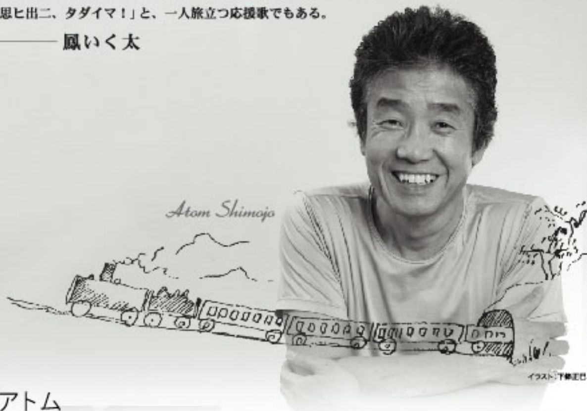
イラスト：下條正巳