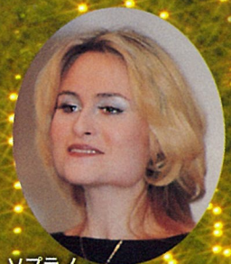
ソプラノ マリーナ・ポブラフスカヤ

厳かに響く弦の音色、天上から降りそそぐ歌声 クリスマス・キャロルの雰囲気をつつぷりと聴かせる 名門劇場の精鋭ソリストたちが贈る 名曲を集めたクリスマス・コンサート