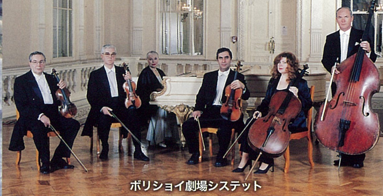
ボリシヨイ劇場システット

厳かに響く弦の音色、天上から降りそそぐ歌声 クリスマス・キャロルの雰囲気をつつぷりと聴かせる 名門劇場の精鋭ソリストたちが贈る 名曲を集めたクリスマス・コンサート