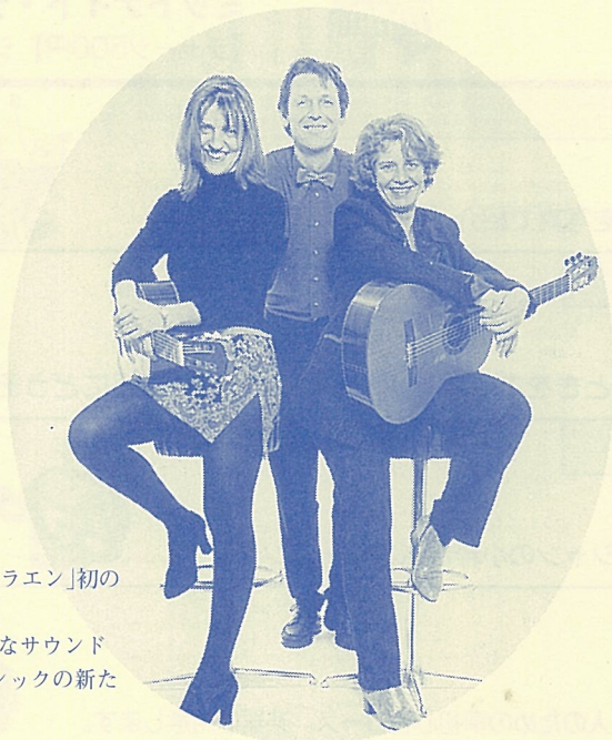
アムステルダム・ギター・トリオ

水の国・オランダより、「クラエン」初の海外アーティスト登場！ ギター3本、18弦の表情豊かなサウンドと斬新なアレンジに、クラシックの新たな一面を見る。