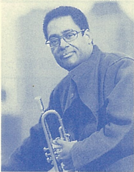
ジョン・ファディス(トランペット)

ジャズのメッカ、ニューヨークから6人の凄腕がコラーレに来日！ カーネギーホールの興奮をコラーレで！