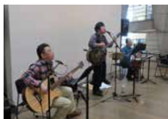
AGE25 バンド演奏 (ロック) 3月6日(日) 13:30