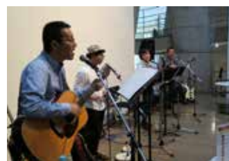
アコギを楽しむ会 アコースティックギター演奏 3月6日(日) 15:30