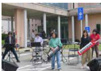
キーボードオーケストラ シンセサイザー演奏 3月5日(土) 14:00

コラーレのあちこちで、いろんなアーティストたちが登場します。ギターやシンセサイザーの演奏、バルーンアートなど、さまざまなパフォーマンスをお楽しみください。※出演者や時間などは、変更になる場合があります。