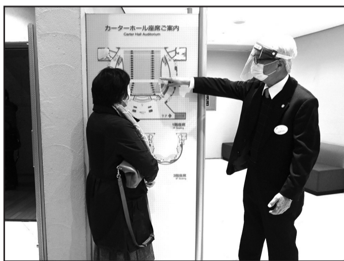
コロナ時代の必須アイテム。マスク、フェイスガードを付けて、3密を回避するため出来るだけ距離を置いて、話すときは小声で、でもわかりやすい案内に気を配ります。男性メンバーも活躍中。