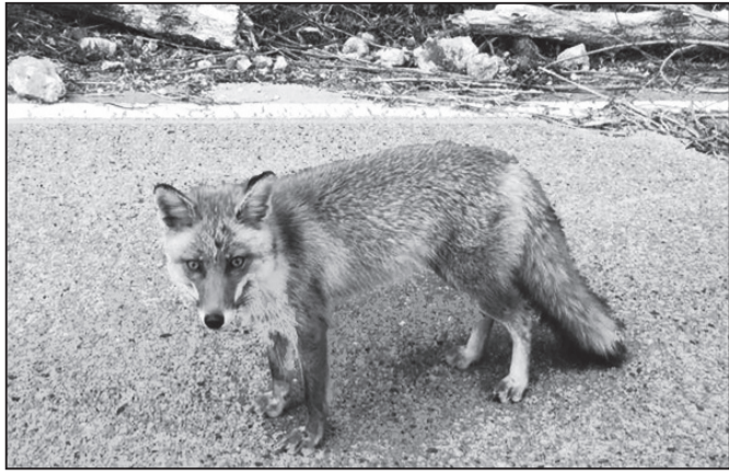
まきばの風から嘉例沢森林公園に向かう山道で、ぱったり狐と遭遇。えっ、ホント!? 狐につままれたよう。200mほどにわたって、ついてきました。 <ナイスミーチャー>