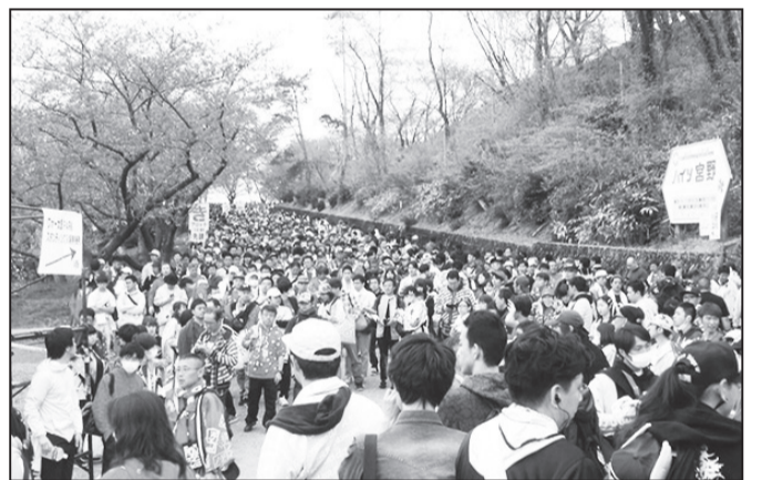
4月20・21日は、ももクロファン（モノノフ）さんたちの熱気に包まれた宮野山でした! 推しのコの色を身にまとうファンの波……かっついてない黒部の光景でした! <まるお>