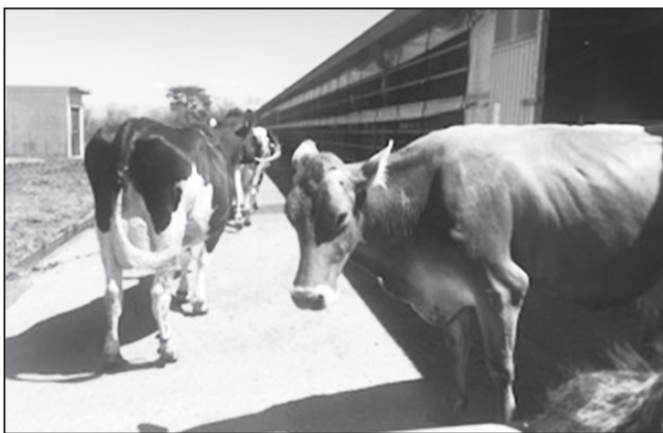
まきばの風に行ってきました。春が訪れ、数ヶ月ぶりに外へ出る瞬間。列を作って続々と飛び出しています。小走りしながら尻尾をふりふり、テンションマックスです。 <牛っておっきい!>