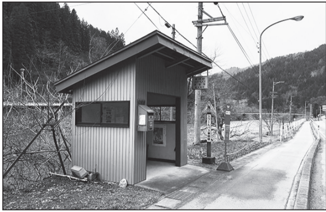
JR東海の角川駅から少し離れたところにあるバス停。このバス停自体は、すでに使われていませんが、未だにアニメ映画の聖地巡礼として訪れるお客がいます。 <君の名は。>