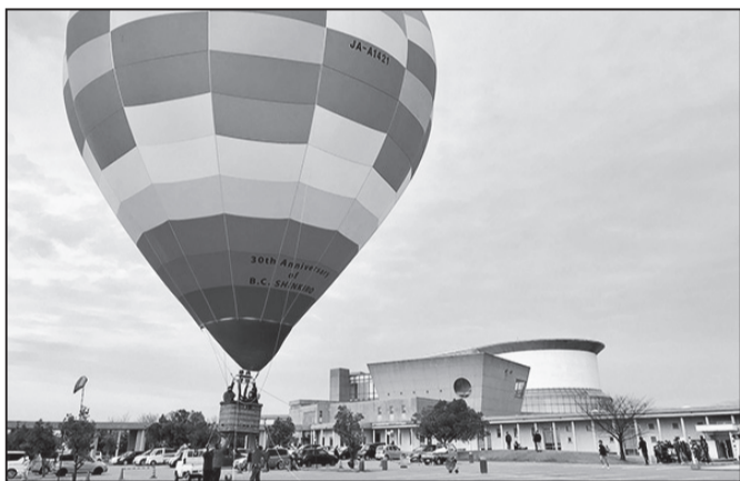
♪ Would you like to ride in my beautiful balloon? 3月の「Earth Moving」でカラーレの駐車場に登場。興奮の空中散歩、私も乗りたいよ。 <I can fly>