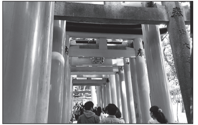
「お稲荷さん」の総本宮が京都の伏見稲荷大社。願い事が「通る」御礼の意味から、鳥居を奉納する習慣が広がった結果だそうです。 <朱は魔力に対抗する色>