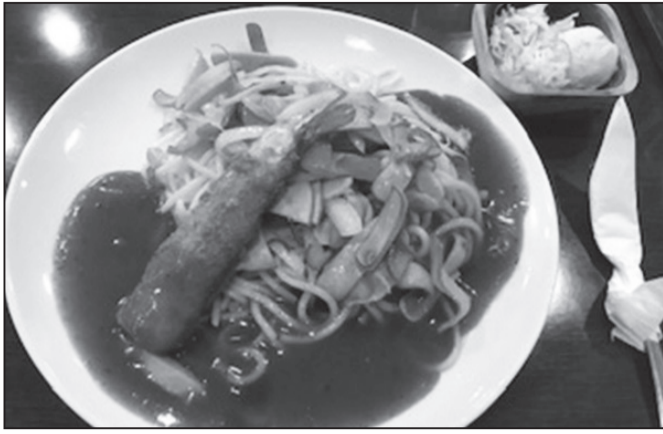
名古屋名物あんかけスパゲティ! スパイスの効いた濃厚あんに、エビフライをからませて食べるのが好き。2.2mmの極太麺の生産地はなんと富山県だそうです。 <病みつきになる味>