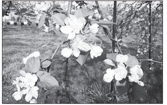
ふんわりと甘い芳香のリンゴの花。今年はゴールデンウィークあたりから受粉作業に大忙しのリンゴ農家さんでした。安定の気象を願って。実りの秋が無事きますように! <ひばり>